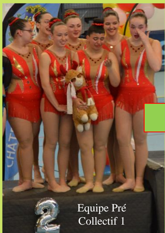
Equipe Pré Collectif 1