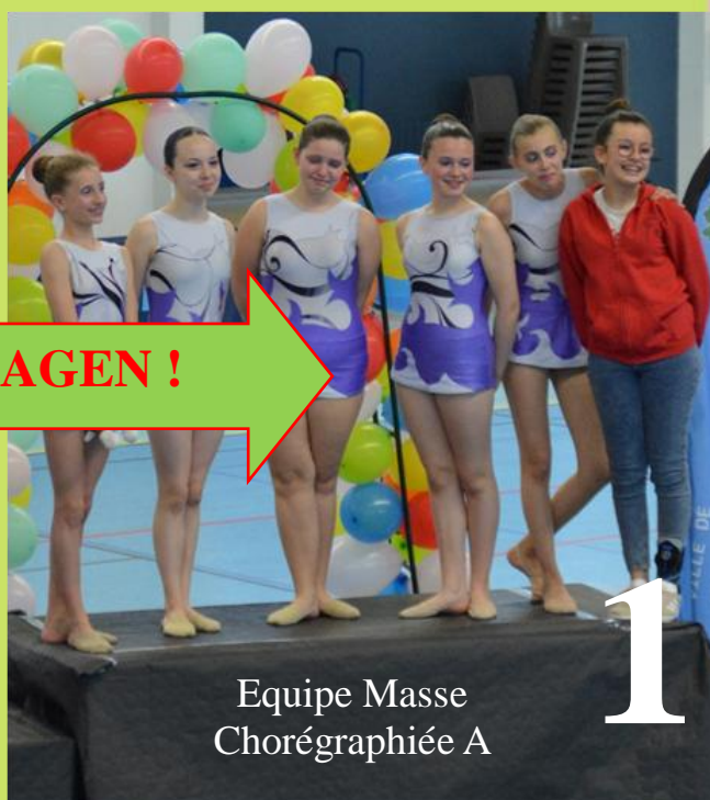
Equipe Masse Chorégraphiée A

Actuellement en préparation des championnats de France, nous souhaitons le meilleur à nos deux équipes qualifiées !