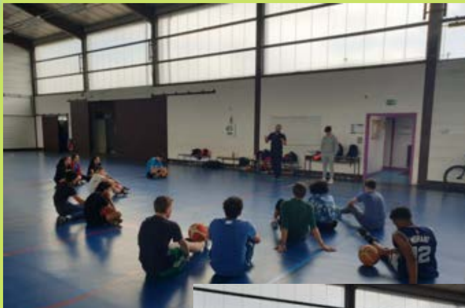
Stage d'arbitrage du 22 avril 2023