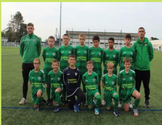
U13 2ème à Tournoi Indoor U11 1er à Guémené