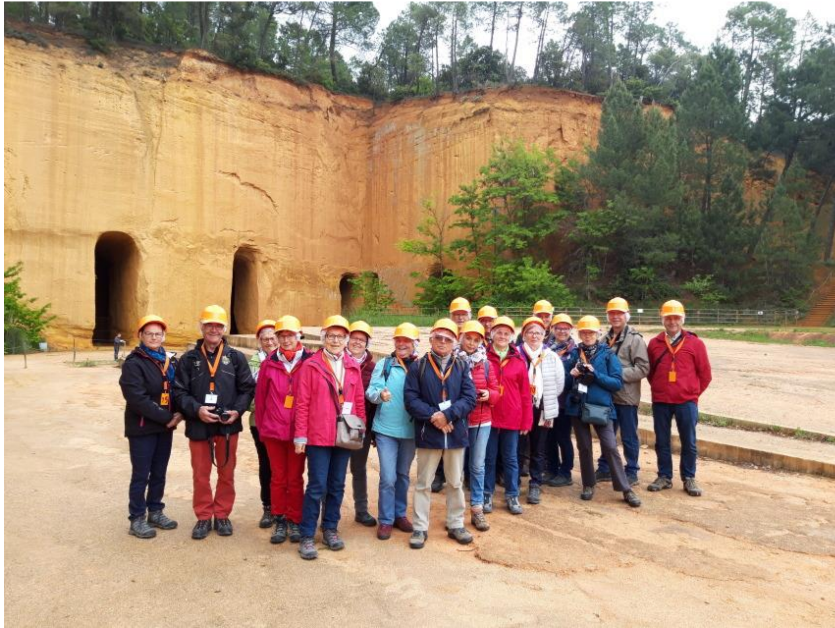
Circuit de 650 mètres de galeries parcouru en deux groupes distincts pendant 1h30 au sein d'un réseau souterrain de plus de 40km. Température moyenne de la galerie : 10°C vérifiée ! Après-midi découverte du village de Céreste.