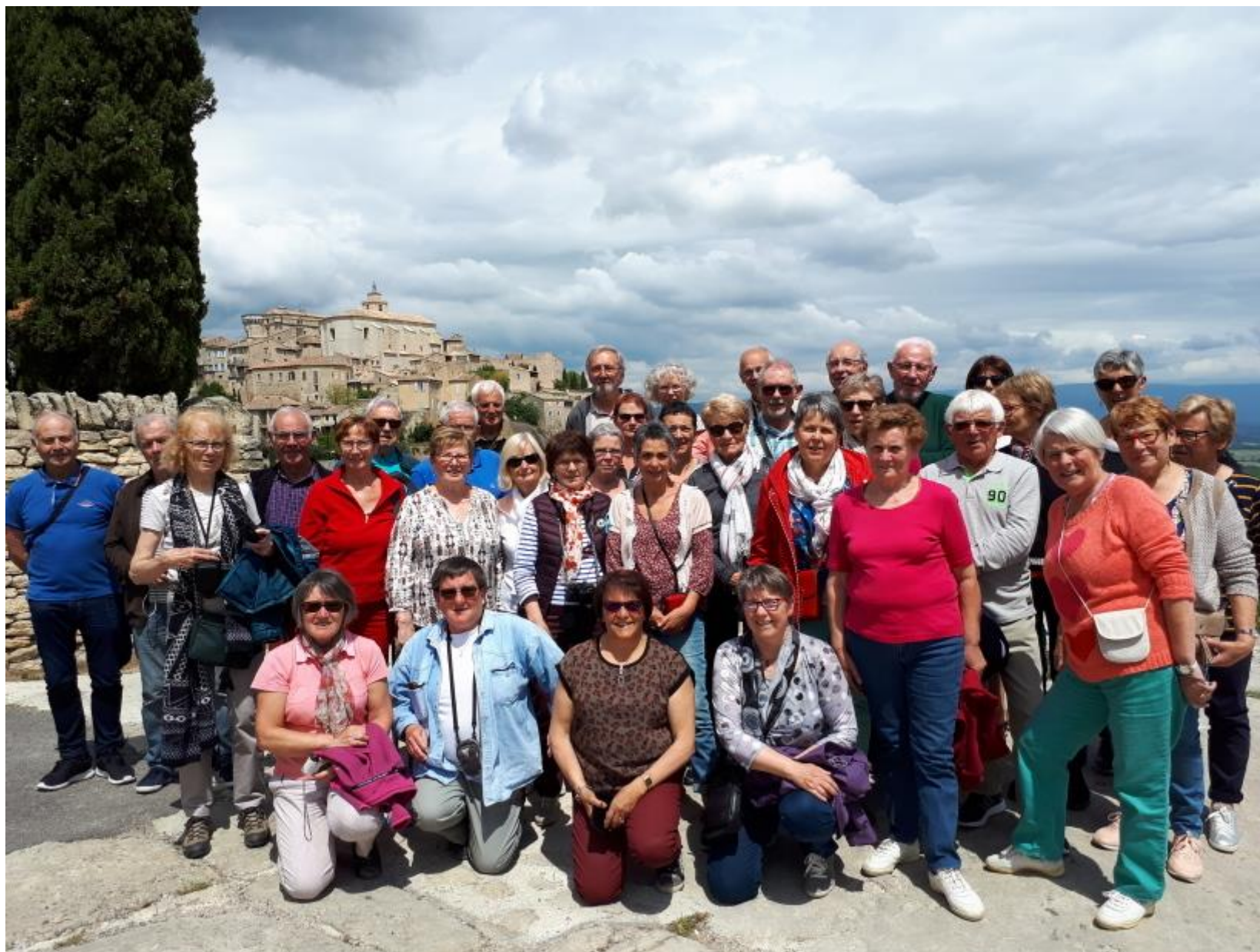
Les villages typiques du Sud Luberon: Gordes: village dressé sur son rocher. Son château forteresse et son église qui dominant les maisons du village. Puis Ménerbes.